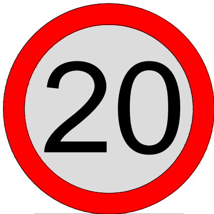
ZNAK B - 33