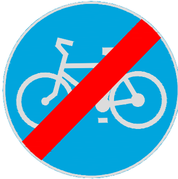
ZNAK C - 13a