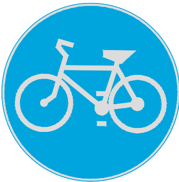
ZNAK C - 13