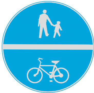
ZNAK C - 1316