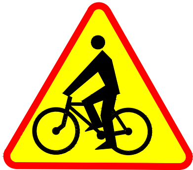
ZNAK A - 24