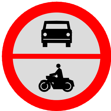
ZNAK B - 3/4