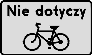
ZNAK C - 1316a