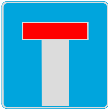
ZNAK D - 4a